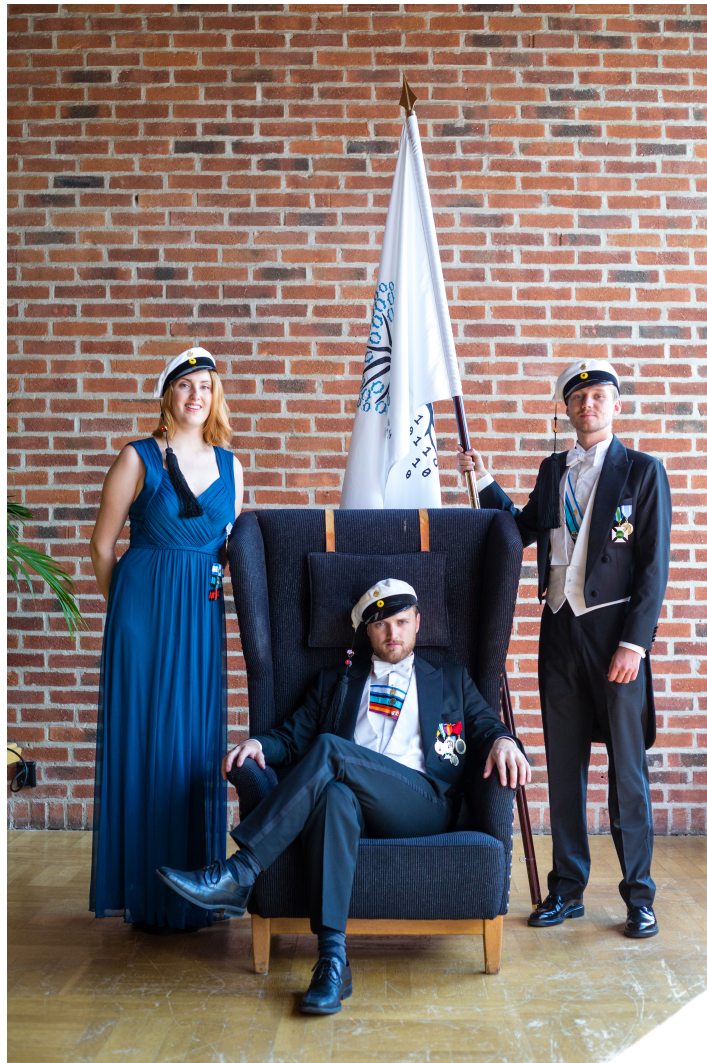
Figur 1: Tack för oss! <3

Detta i högtidsdräkt och helt i ordning med såväl åtagande som Verksamhetsplan.